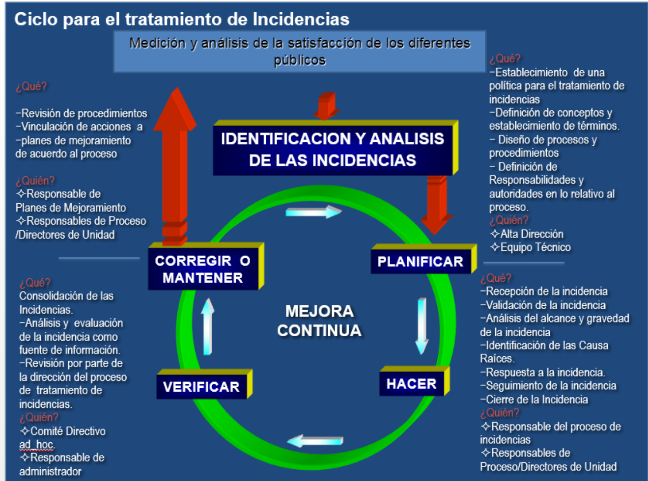
Figura 1. Ciclo PHVA para el tratamiento de incidencias